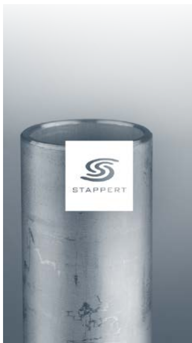
Produits longs inox