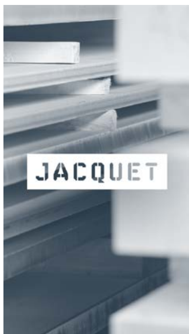
Tôles quarto inox